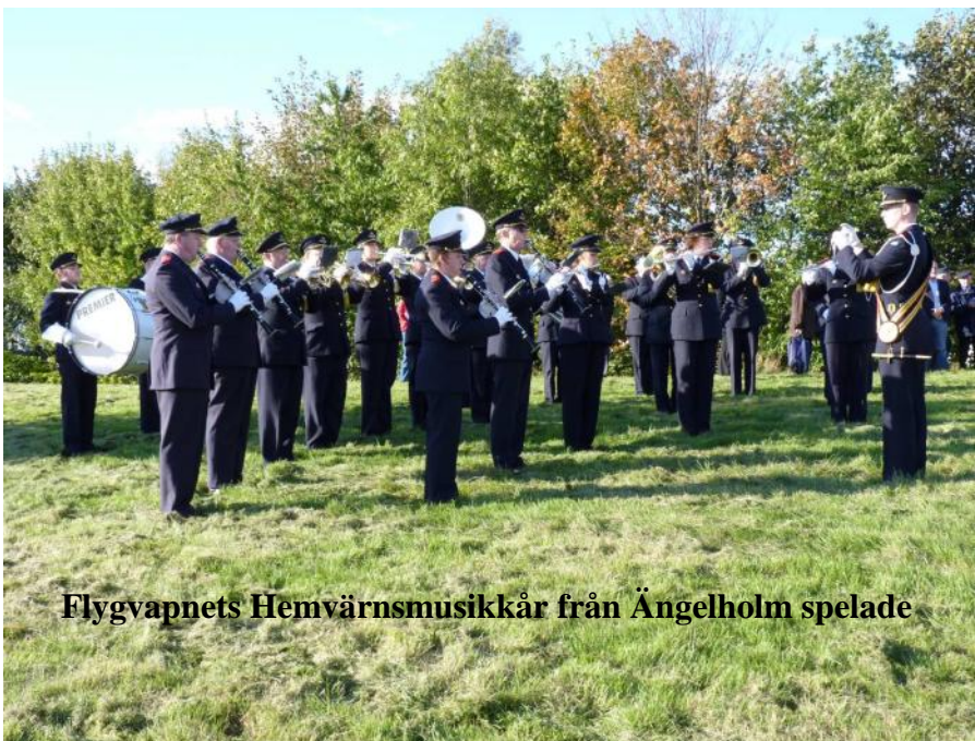
Flygvapnets Hemvärnsmusikkår från Ängelholm spelade