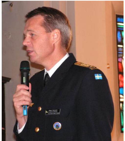
Flygvapeninspektören reflekterare över personalens risker igår och idag.