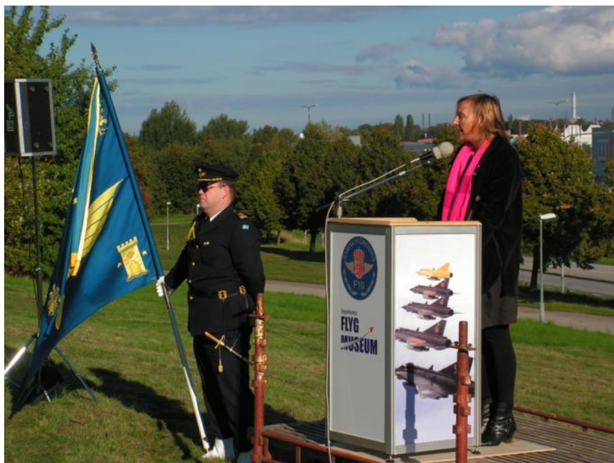
Minnestal av Malmös kommunalråd Carina Nilsson.