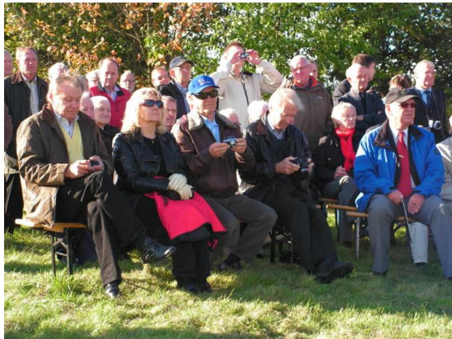
Publik vid Minnesmärket.