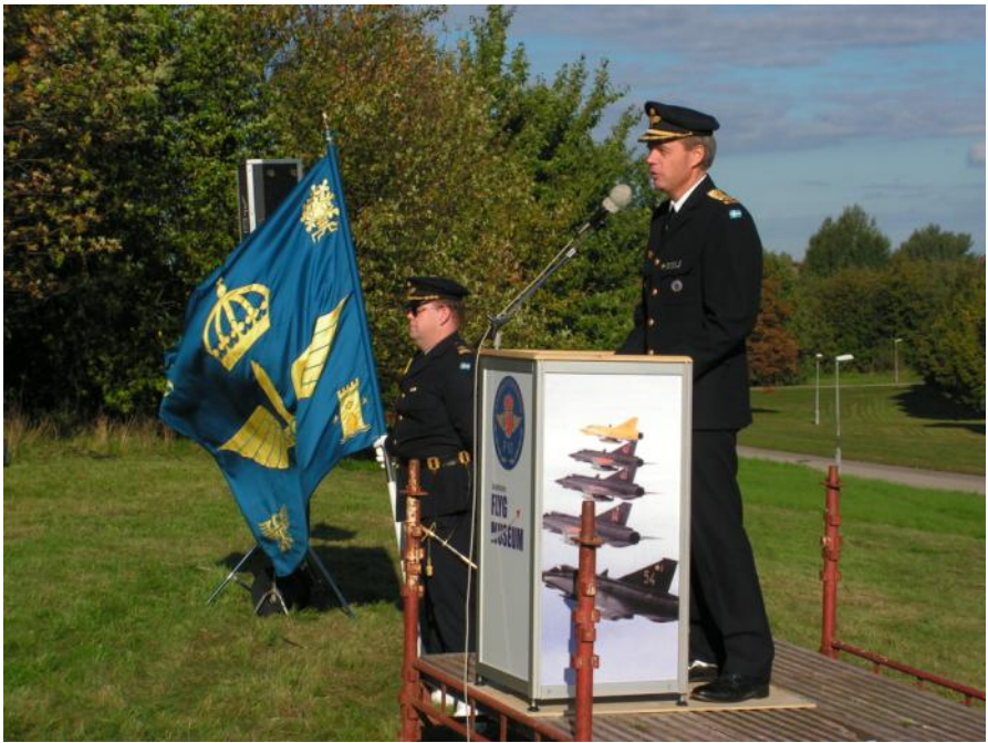
Minnestal av Flygvapeninspektören Anders Silwer.