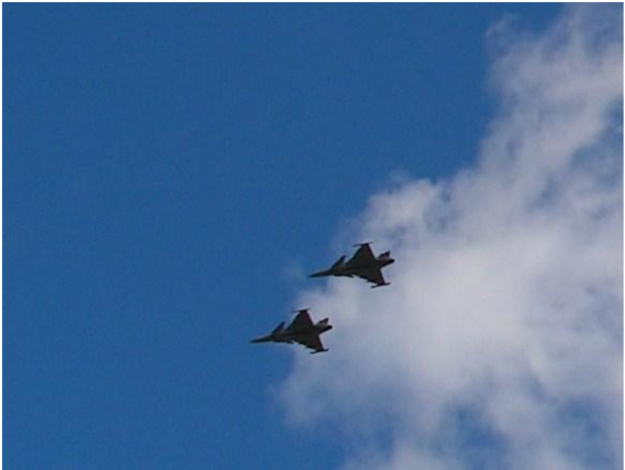
Överflygning rote Gripen från F 17.