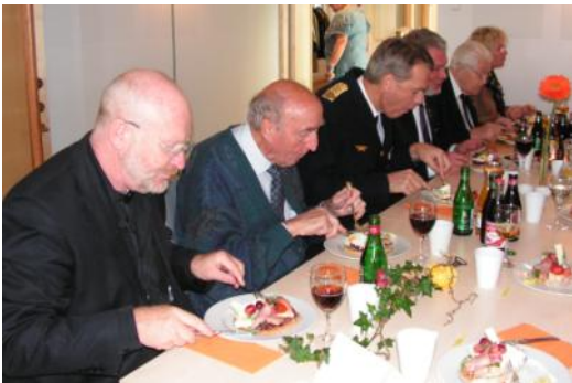
Rundkaka med kaffe på Kirsebergs Församlingshem.