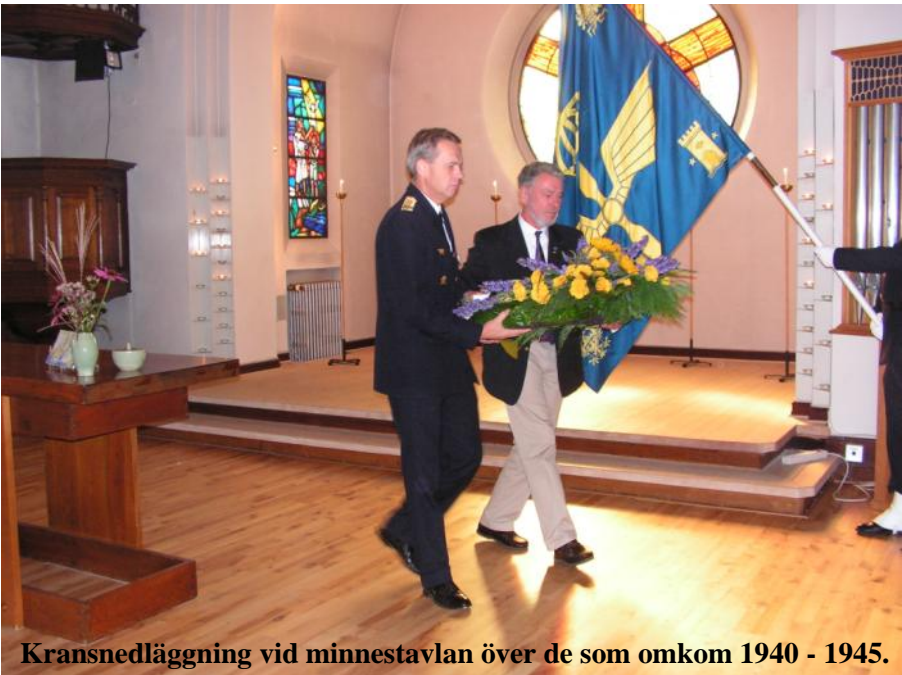
Kransnedläggning vid minnestavlan över de som omkom 1940 - 1945.